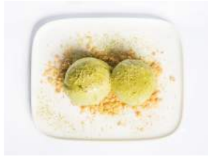
GREEN TEA ICE CREAM 4,50

vihreä tee jäätelö digestiivi murun kanssa / green tea ice cream with digestive crumble