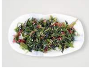
WAKAME SALAD 5.00

/ TO BE ENJOYED WITH THE MEAL OR ON IT'S OWN