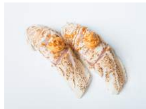
SPICY SHIROMASU 6.20

kevyesti grillattua siikaa, valkosipuli- majoneesia, yakitori- kastiketta, ruohosipulia / slightly grilled whitefish, garlic mayonnaise, yakitori sauce, chives