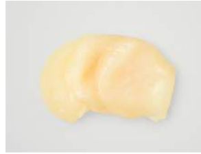
HOTATE SASHIMI 7.20