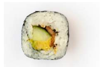
VEGE MAKI 8.50

kurkkua, tofua, avokadoa, seesaminsiemeniä / cucumber, tofu, avocado, sesame seeds