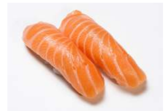
SHAKE NIGIRI 5.70

kevyesti grillattua merilohta, ruohosipulia, majoneesia / slightly grilled salmon, chives, mayonnaise