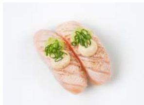
ANNABELLE NIGIRI 6.00

friteerattua marinoitua tofua, punakaalia, wafu- kastiketta, kevätsipulia / deep fried-marinated tofu, red cabbage, wafu dressing, spring onion