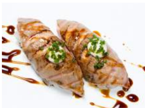
SHAKE SUPREME 6.10

avokadoa, ruohosipulia, tuorejuustoa, yakitori- kastiketta / avocado, chives, cream cheese, yakitori sauce