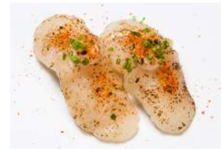
SPICY HOTATE NIGIRI 7.40

kevyesti grillattua kampusimpukkaa, ruohosipulia, valkosipulimajoneesia, yakitori-kastiketta / slightly grilled scallop, chives, garlic mayonnaise, yakitori sauce