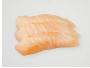
HAMACHI SASHIMI 9.20