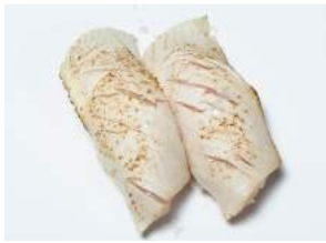
GRLLD HAMACHI NIGIRI 8.00

kevyesti grillattua isopiikkimakrillia / slightly grilled hamachi