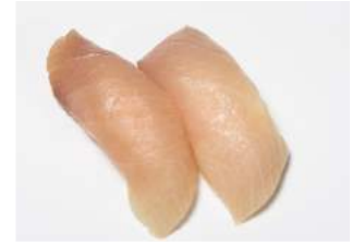
HAMACHI NIGIRI 6.60

siitakesieniä, ruohosipulia / shitake mushroom, chives