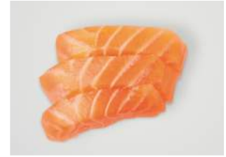
SHAKE SASHIMI 6.50