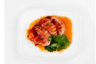
GRILLED KORISHAKE 6,70

kevyesti grillattua merilohta, siikaa, isopiikkimakrillia kampusimpukkaa, ponzusoijaa, seesaminsiemeniä / slightly grilled salmon, whitefish, hamachi, scallop, ponzu soy, sesame seeds