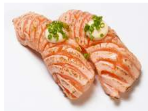
GRLLD SHAKE NIGIRI 6.20

erikoisleikattua merilohta, valkosipulimajoneesia, yakitori-kastiketta, ruohosipulia / special cut salmon, garlic mayonnaise, yakitori sauce, chives