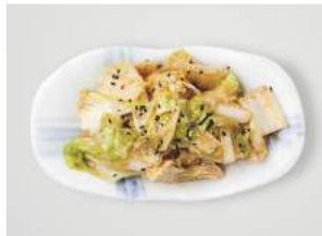
KIM CHI 4.40

korealaista mausteista kaalisalaattia, seesamin siemeniä / spicy korean cabbage, sesame seeds