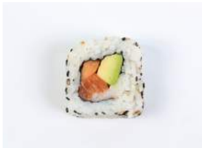
SHAKE CANTALOUPE 9.60

kevyesti grillattua merilohta, avokadoa, kevätsipulia, spicymajoneesia / slightly grilled salmon, avocado, spring onions, spicy mayo