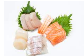
ISO LAJITELMA 29.90

merilohta, siikaa, isopiikkimakrillia 3 pcs / each / dish / salmon, whitefish, hamachi