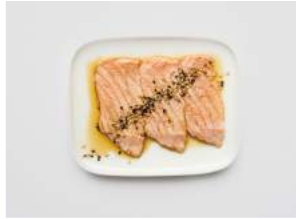
GRILLED SHAKE 6,20

/FRESH BITE-SIZE FISH OR SEAFOOD SLIGHTLY PREPARED