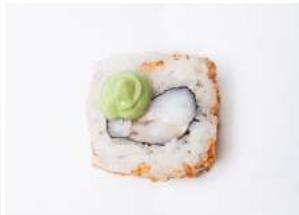
PRAWN MOUSSE 10.00

merilohta, avokadoa, cantaloupemelonia, seesaminsiemeniä / salmon, avocado, cantaloupe melon, sesame seeds