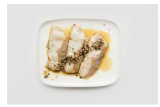
GRILLED SHIROMASU 6,90

kevyesti grillattua isopiikkimakrillia, ponzusoijaa, seesaminsiemeniä / slightly grilled hamachi, ponzu soy, sesame seeds