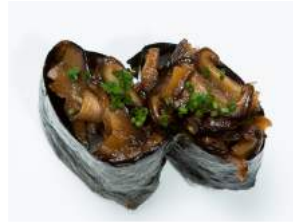
SHITAKE GUNKAN 5.00

tiikerirapua, chiliseesam-aioli, ruohosipulia / tiger prawns, chili sesame aioli, chives