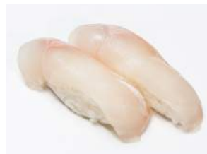
SHIROMASU NIGIRI 5.50

jättikatkaravunpyrstöä, avokadoa, majoneesia, seesaminsiemeniä / giant shrimp tail, avocado, mayonnaise, sesame seeds