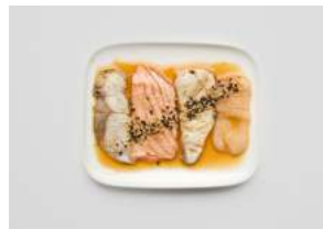
GRILLED ASSORTMENT 10,30

kevyesti grillattua kampusimpukkaa, ponzusoijaa, seesaminsiemeniä / slightly grilled scallop, ponzu soy, sesame seeds