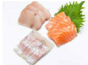
PIENI LAJITELMA 19.90

3 palaa / laatu / annos 3 pcs / each / dish