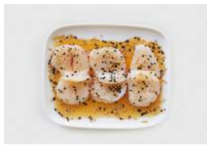
GRILLED HOTATE 8,90

kevyesti grillattua siikaa, ponzusoijaa, seesaminsiemeniä / slightly grilled whitefish, ponzu soy, sesame seeds