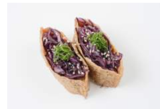
PURPLE INARI 5.00

keyesti grillattua siikaa, chili- seesaminsienmajoneesia / slightly grilled whitefish, chili - sesame seed -mayonnaise