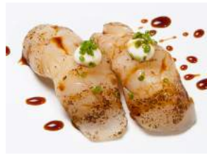
GRLLD HOTATE NIGIRI 7.40

kevyesti grillattua isopiikkimakrillia / slightly grilled hamachi