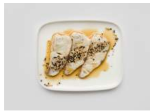
GRILLED HAMACHI 9,70

kevyesti grillattua merilohta, ponzusoijaa, seesaminsiemeniä / slightly grilled salmon, ponzu soy, sesame seeds