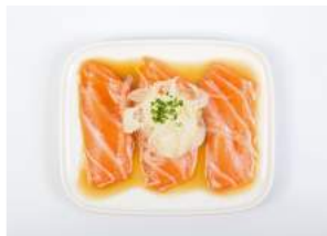
SHAKE FENKOLI 6,40

kevyesti grillattua merilohta, yakitorikastiketta, korianteria, togarashia, ponzusoijaa / slightly grilled salmon, yakitori sauce, coriander, togarashi, ponzu soy