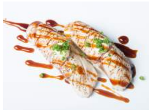
SHIROMASU SUPREME 6.20

friteerattua marinoitua tofua / deep-fried marinated tofu