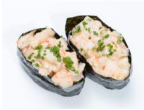
CHILI PRAWN GUNKAN 6.40

2 PALAA/ANNOS 2 BITAR / EN PORTION 2 PCS/DISH