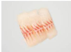
SHIROMASU SASHIMI 7.90