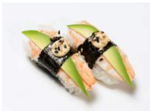
CALIFORNIA NIGIRI 5.90

kevyesti grillattua kampusimpukkaa, spicy majoneesia, ruohosipulia / slightly grilled scallop, spicy mayonnaise, chives