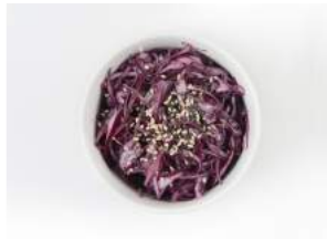
PURPLE SLAW 4.00

vihreitä soiijapapuja, merisuolaa / green soy beans flavored with marine salt