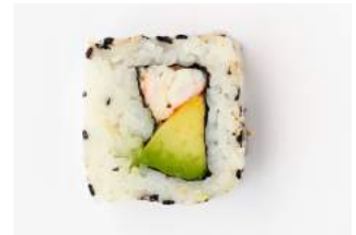
CALIFORNIA MAKI 10.50

tiikerirapua, chiliaiolia, avokadomousse, ruohosipulia, chili seesaminsiemeniä / tiger prawn, chili aioli, avocado mousse, chives, chili sesame seeds