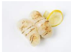
HOTATE ROYAL 7.40

kevyesti grillattua lohta, spicy majoneesia, avokadomousse ja kevätsipulia / slightly grilled salmon, spicy mayonnaise, avocado mousse, spring onion