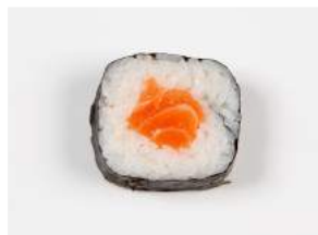
SHAKE MAKI 8.20

kevyesti grillattua merilohta, kevätsipulia, majoneesia / slightly grilled salmon, spring onion, mayonnaise